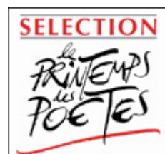
Maison de la Poésie de Paris - 13 décembre 2011